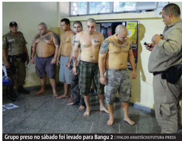
Grupo preso no sábado foi levado para Bangu 2